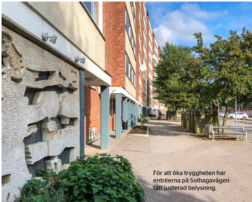
För att öka tryggheten har entréerna på Solhagavägen fått justerad belysning.

Under våren och sommaren kommer fyra undercentraler i Vårby Gård att bytas ut. Det görs för att modernisera värmesystemet och säkra funktionen och driften så att det alltid är lagom temperatur i din lägenhet.