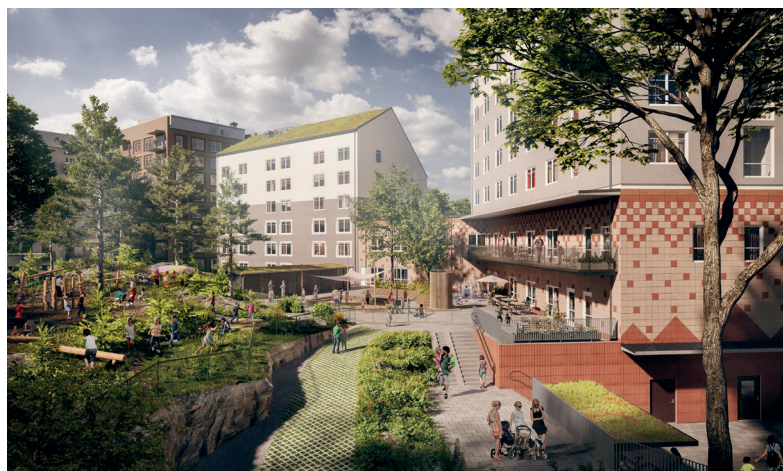
Husen kommer att bilda ett öppet kvarter kring en grön förskolegård med bostäder för olika skeden i livet.