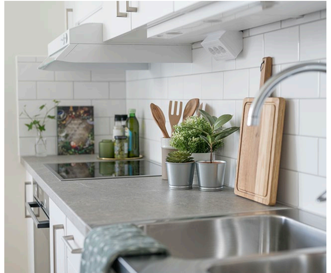
Exempelbild från Sjödalsstorget 3B