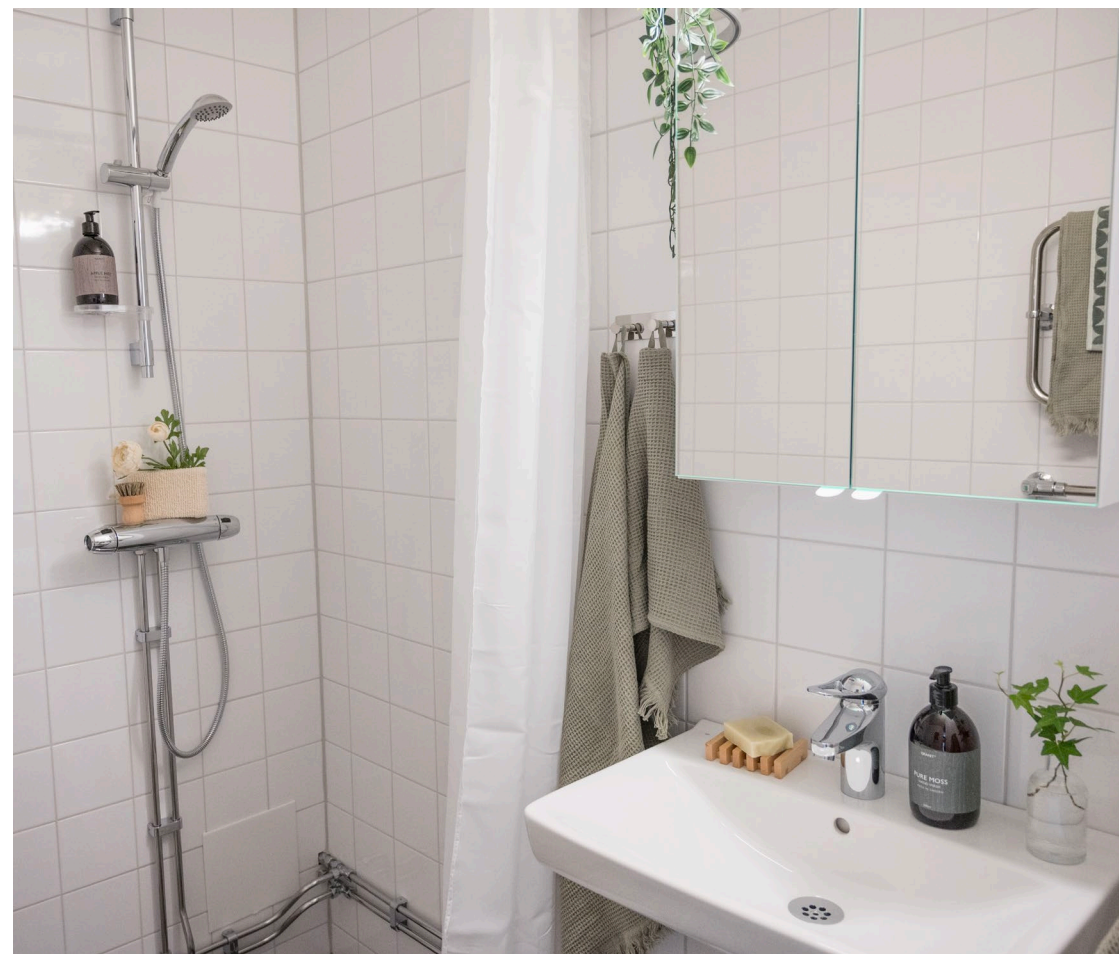
Exempelbild från Sjödalsstorget 3B