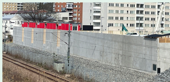
Väggen som ska målas av konstnärer på Streetcorner under hösten 2024.

Vill du bidra med tankar och inspiration till konsten? Välkommen till en workshop på Lyktan i Skogås 19 juni klockan 14.30-17.00. Adress: Skogåstorget 7-9 (övre planet i Skogås centrum). Har du inte möjlighet att komma och bidra med dina idéer går det också jättebra att maila till mikael@streetcorner.se .