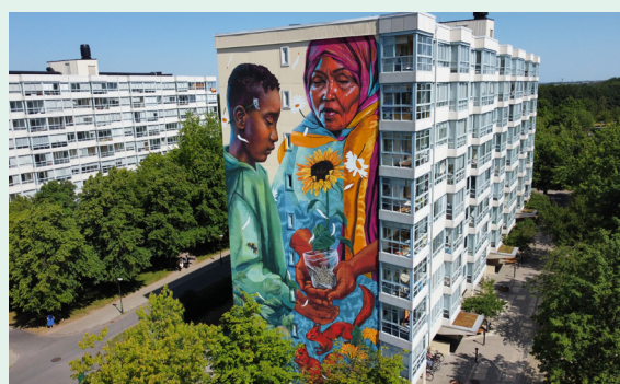
Väggmålning som Streetcorner gjort tidigare i Rosengård i Malmö.