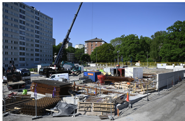
28 maj 2024, arbetet pågår för fullt på byggarbetsplatsen. Det sista pålningsarbetet görs i slutet av maj och början av juni.

Byggkranen för projektet kommer monteras under vecka 32 i augusti, då börjar även resningen av stommen för huset. När kranen kommer på plats kan det bli lite störningar i trafiken vid byggarbetsplatsen. Vi kommer skicka ut mer detaljerad information om hur störningarna kommer påverka vägen.