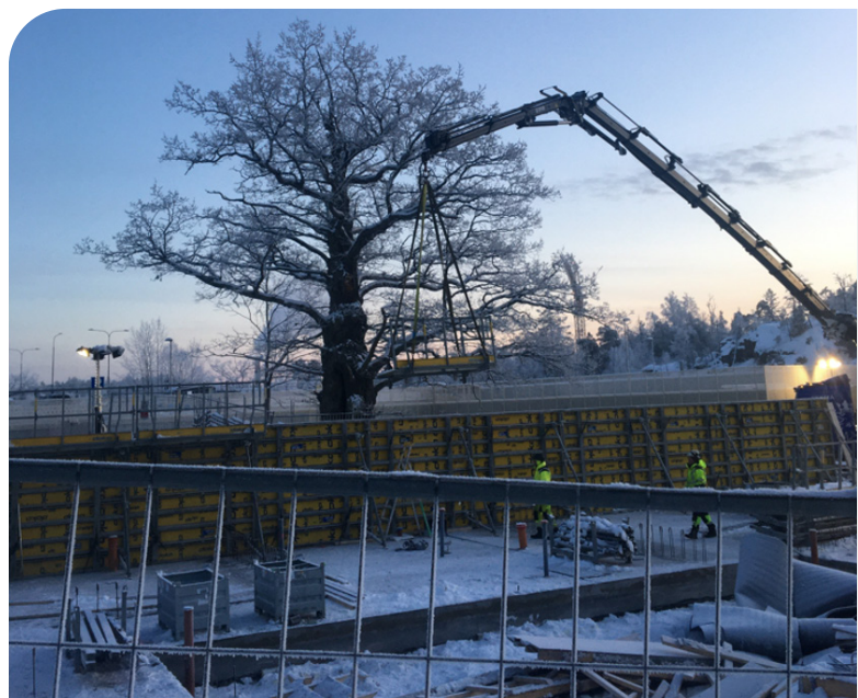
Arbeten med vägg en tidig morgon i december 2023. Väggens färdigställs nu för den används som stöd till den nya genomfartsgatan.

Eftersom byggarbetsplatsen ligger så nära järnvägen (pendeltåg och annan järnvägstrafik) behöver man tillstånd från Trafikverket. All tågtrafik måste stoppas under en sprängning, perrongen måste tömmas på trafikanter och efter varje sprängning måste räls, perrong och stolparna för ledningarna besiktas. Detta skulle ta så lång tid att man inte skulle hinna mellan den ordinarie tågtrafiken. Det innebär att den enda möjliga tid för att kunna genomföra sprängningar på denna plats är mellan klockan 03.00 och 05.00 på morgonen – en ytterst olämplig tid för att utföra sprängningar i bostadsområden.