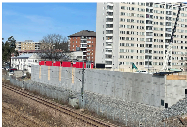
Väggen som ska målas av konstnärer på Streetcorner under sommaren 2024.