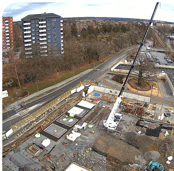
April 2024. Under tiden vi utför markarbeten finns risk att vi hittar mer berg som måste tas bort. Det ska förhoppningsvis ske innan augusti.

Vill du bidra med tankar och inspiration till konsten kan du maila till mikael@streetcorner.se .