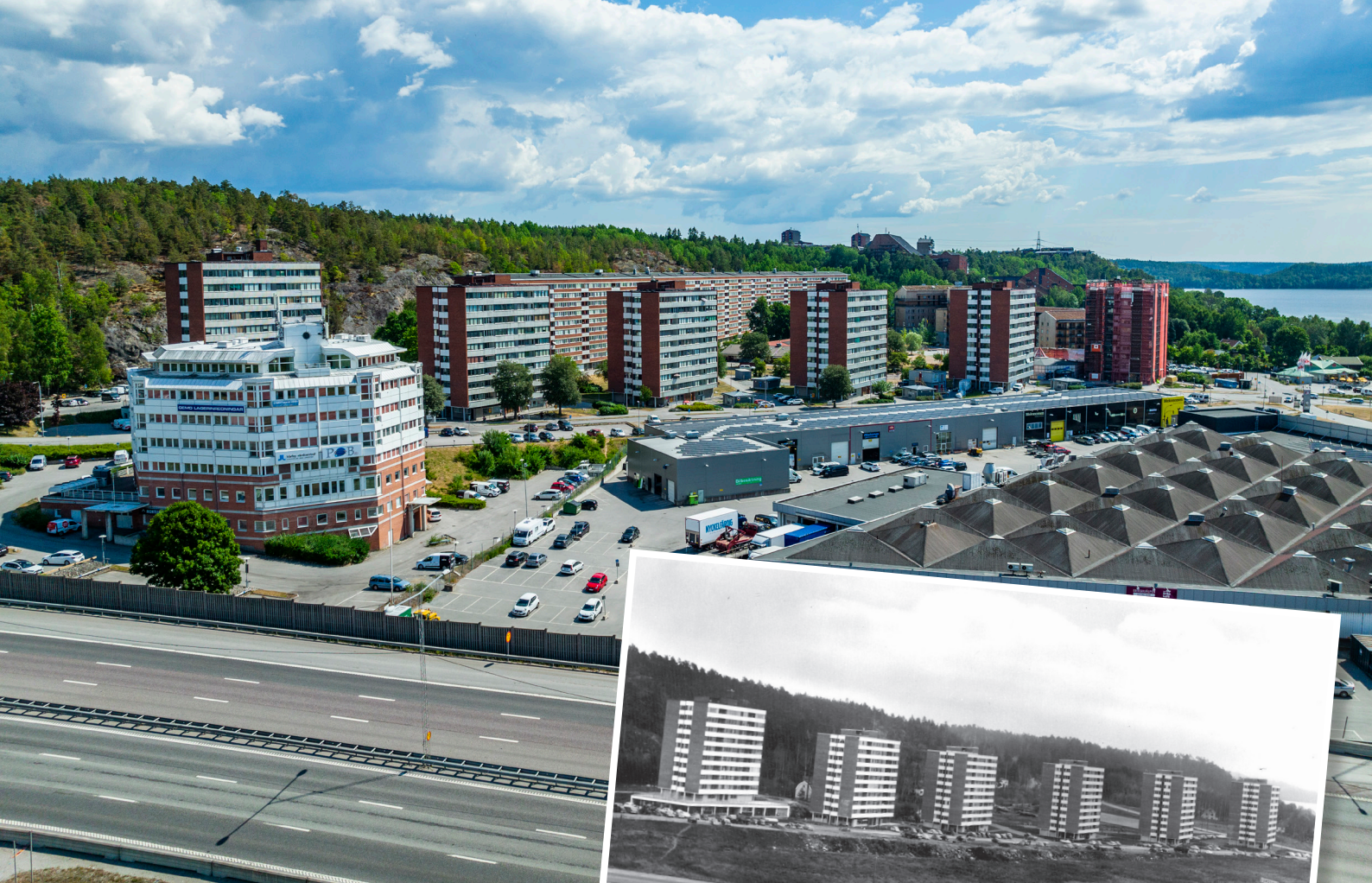
Botkyrkavägen nu och då - De sex punkthusen med sina karaktäristiska fasader omkring år 1962, innan "Ormen Långe" uppfördes. Fotograf: okänd. Från ett äldre vykort.